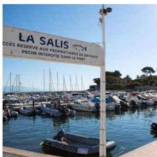
Le Port de la Salis