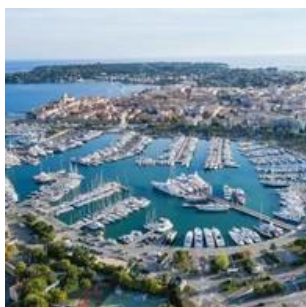
Le Port Vauban