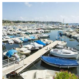
Le Port du Croûton

Ces ports de plaisance sont implantés sur nos côtes depuis des années. Ils permettent d'accueillir tous types de bateaux de plaisance, du plus grand (150 mètres) au plus traditionnel tel que le pointu . De nombreux industriels et artisans spécialisés offrent leur service au monde de la plaisance. A savoir que l'activité nautique induit 2500 emplois sur la commune.