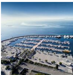
Le Port Gallice