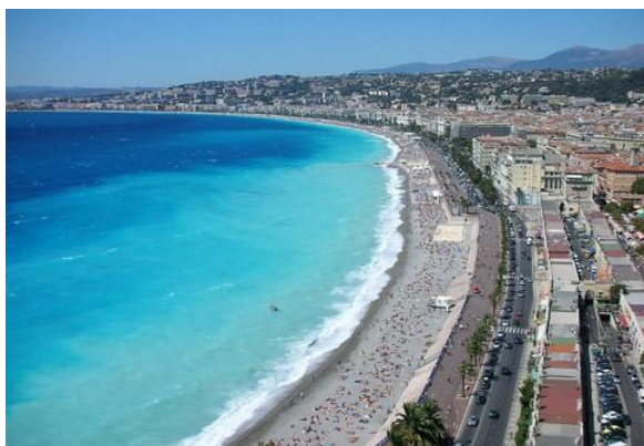
Baie des Anges

Le Cap d'Antibes partage le littoral, en deux baies, la baie des Anges et la Baie de Golfe-Juan. A chaque zone correspond un bassin versant et un hydrodynamisme particulier :