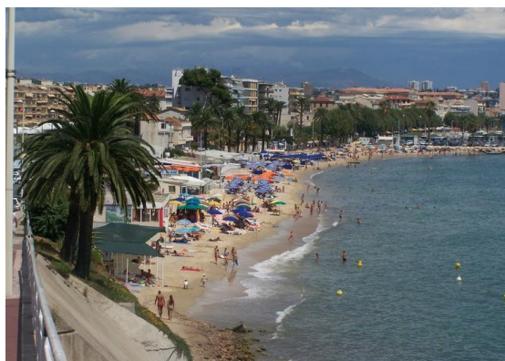
Baie de Golfe Juan